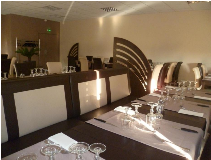
le club house