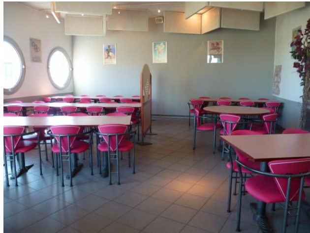
Salle de restauration pour la sayonara party