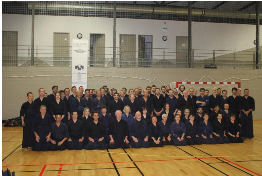
Les participants de l'édition 2018